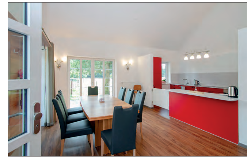
Der offene Küchenbereich freut sich auf Gäste.

Fazit: Ideale Lage für Auszeiten vom Alltag, Wohlgefühl auf hohem Niveau – und das alles zu einem fairen Preis-Leistungs-Verhältnis. Die Übernachtung in der Suite kostet für zwei Personen 159 Euro, Frühstück und Lunchpaket inklusive.